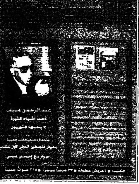
عبد الرحمن منيف

من دار الشروق للنشر والتوزيع في عمان صدر العدد الثاني عشر من مجلة «الجديد» المتخصصة في عالم الكتب